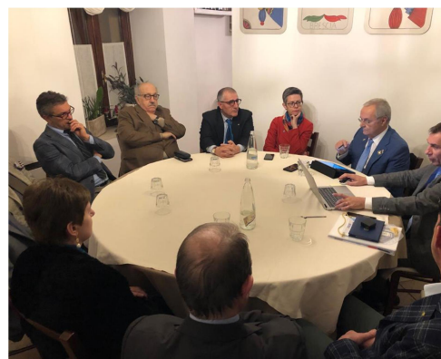
L'incontro con il Direttivo ed i Presidenti di Commissione