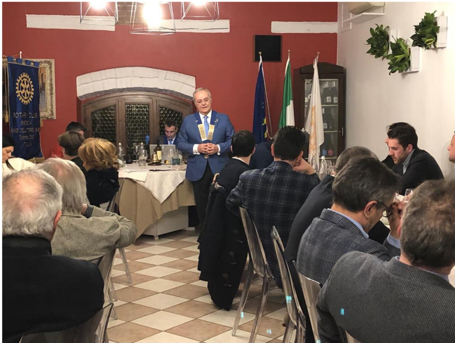
L'intervento del Governatore Maurizio Mantovani

Per quanto riguarda il primo, ossia connettere le persone, bisogna prima di tutto connettere i soci all'interno del club, e creare nuovi leader mediante la rotazione di cariche e ruoli e favorendo la formazione interna. Bisogna sapere individuare le necessità dei nuovi soci per poterli cooptare, ma oltre a cercare nuovi soci, è ancora più importante confermare l'effettivo: Il Rotary perde 3500 soci all'anno, dobbiamo quindi conservare i soci e tutti insieme dobbiamo collaborare per trasformarli in veri Rotariani. Nel distretto 2050 partendo da -29%, nel I semestre abbiamo fatto un -2% ma è sempre un valore negativo. Nel II semestre dovremo fare ancora meglio.