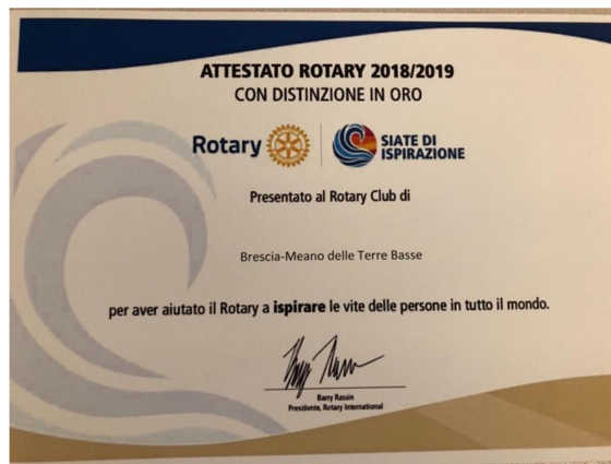
l'Attestato presidenziale con distinzione in Oro per l'AR 2018/2019

Il Governatore, riferendosi ai temi presidenziali degli ultimi anni ( il Rotary connette il mondo - Siate di ispirazione - Facciamo la differenza ) ha spiegato che per mezzo di questi temi i Presidenti sanno dove portare il Rotary, e con gli obiettivi che pongono ai Club tendono a guidare il cambiamento. Il Rotary è infatti a un bivio ma con la capacità dei singoli rotariani saprà scegliere la strada giusta.