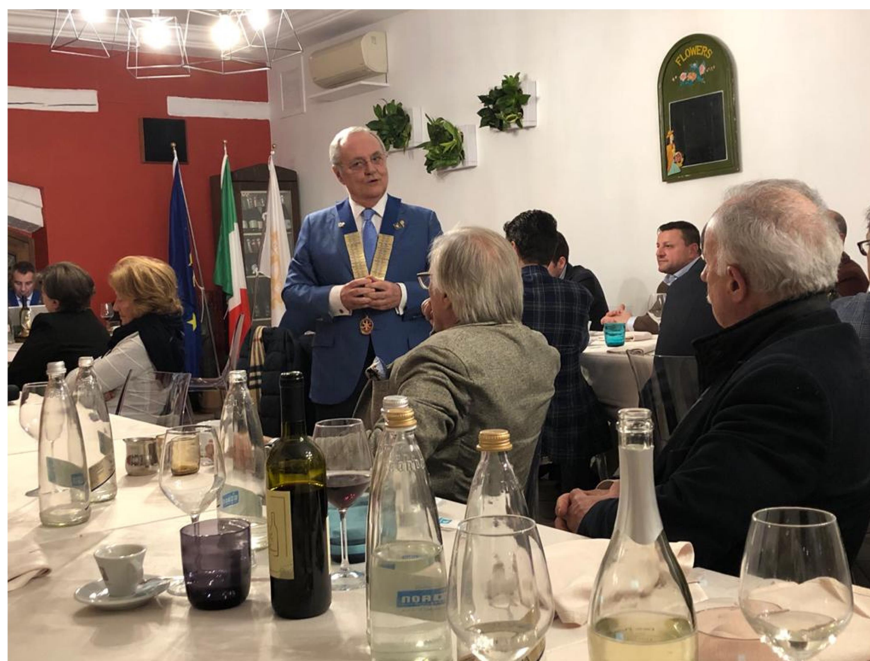
L'intervento del Governatore Maurizio Mantovani

I Service cambiano la vita delle persone, come ad esempio l'eradicazione della Polio, ma anche con piccoli service, ad esempio mandare i giovani al RYLA, o lo scambio giovani del RYE, possiamo cambiare in meglio la vita delle persone che beneficiano del nostro intervento. Il RYE ad esempio migliora la comprensione tra i popoli, ed aiuta a costruire la pace, missione che è nel DNA del Rotary.