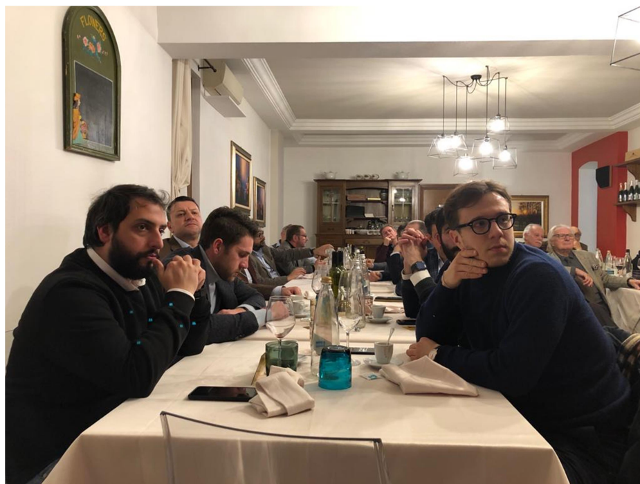
I ragazzi del Rotaract seguono l'intervento del Governatore Maurizio Mantovani

Relativamente al secondo obiettivo, ovvero passare all'azione, il Governatore ha ricordato come ci si debba preparare per sfruttare al massimo, a livello di visibilità e attenzione nella propria comunità. Mantovani ha citato ad esempio il risultato dell'eradicazione della Polio: per la giornata mondiale della Polio tutti i club del Distretto sono andati in piazza, hanno illuminato i monumenti ed hanno fatto sapere a tutti quello che il Rotary è riuscito a realizzare.