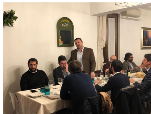
Le testimonianze dei soci