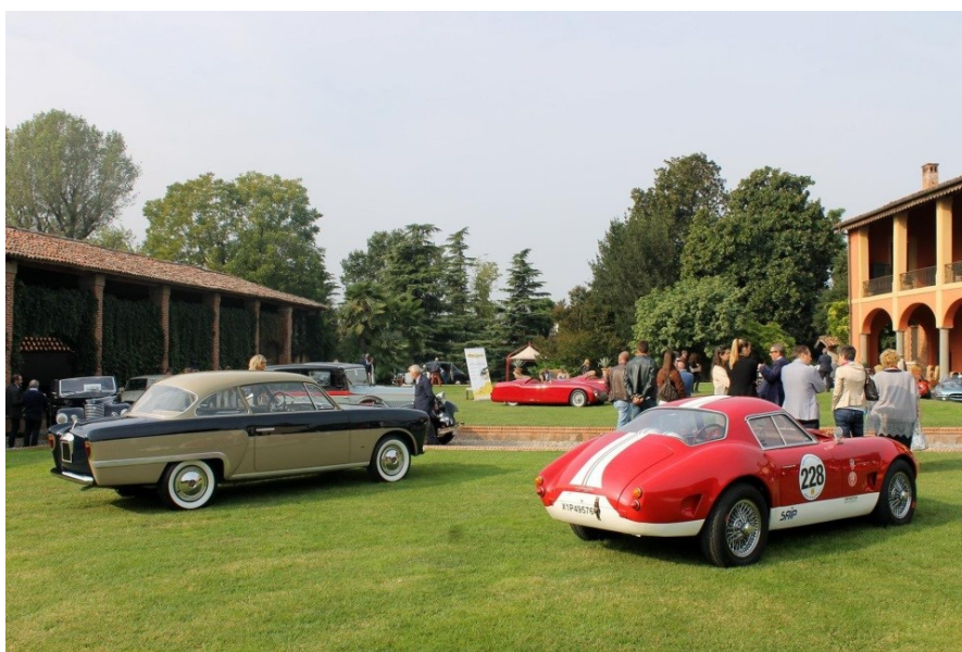
Le eccezionali vetture, autentiche regine, nella cornice del Castello